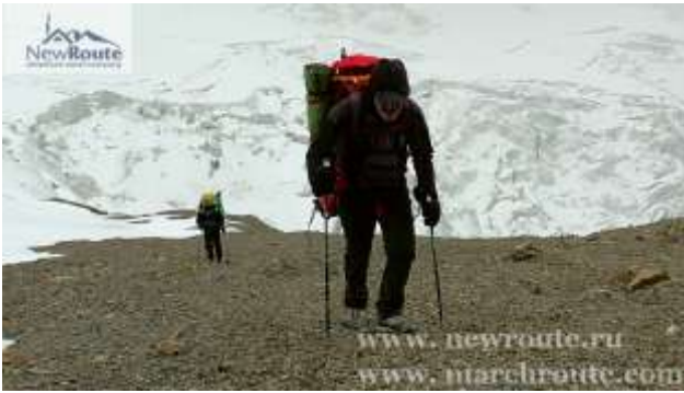
Последний подъем перед к Лагерем-2