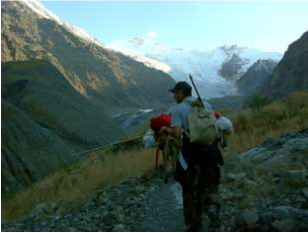
Вид на ущелье Геналдон и ледник Майли