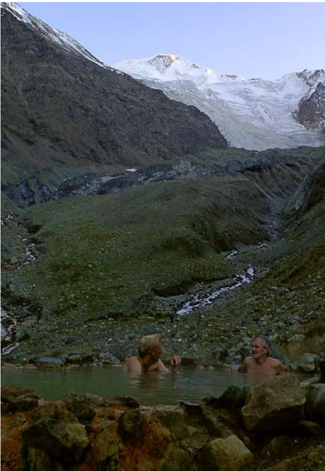
Горячие источники в Базовом лагере