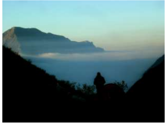
Вечерний туман, вид с Базового лагеря, 2300м

День 2. Сегодня нам предстоит первый акклиматизационный выход на склоны в.Геодезист (4100м) до высоты 3500м. По пути проводим краткие скальные и ледовые занятия, в ходе которых, мы отработаем основные приемы страховки (использование подъемных/спусковых и страховочных устройств) и различные техники передвижения по скалам и льду. Впечатляющий панорамный вид ледника Майли и в.Казбек не оставит равнодушным. Вечерние горячие ванны - опять как нельзя кстати.