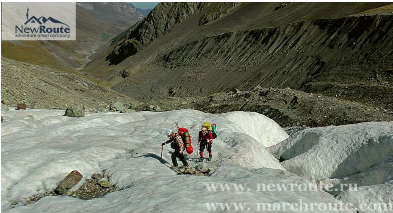
Подъем по леднику Майли

День 3. Переход на высоту 3400м и установка Лагеря-1 – вот наша основная задача на сегодня. Ранний подъем, плотный завтрак и вот мы уже на тропе. После непродолжительного перехода оказываемся под языком ледника – время одевать кошки! Достаточно крутой подъем на тело ледника, а дальше уже легче. Выйдя на осыпной склон, надеваем каски, и очень осторожно, преодолеваем первые 100м (при необходимости используем перильные веревки или связываемся). Далее тропа немного выполаживается, но все равно нужно быть предельно осторожным (большое количество “живых камней”). Большая площадка под палатки на высоте 3400м – вот мы и на месте! Ужин с видом на разорванный ледник и панораму всего цирка – достойная награда за сегодняшнюю работу!