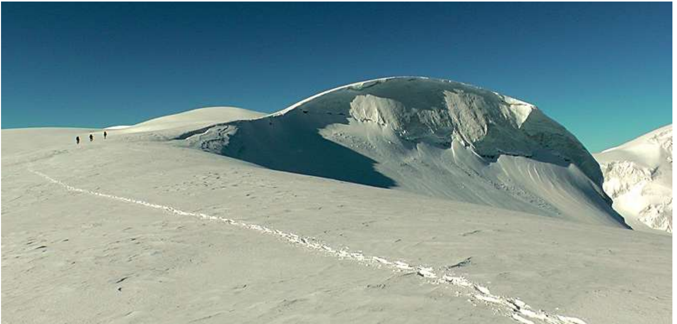
На перевале Майли 4400м

День 5. День восхождения начинается с раннего подъема, завтрака и проверки снаряжения. Рассвет мы встречаем уже на Майлинском плато и с первыми лучами солнца идти уже гораздо веселей! Плавный подъем на перевал Майлинский (4400м). Скальная гряда на вершине перевала – отличное место чтобы выпить горячего чаю, любуясь восхитительным видом огромных снежных полей Казбекского плато. Еще два часа пути по плато, и у перевала Казбекский наша тропа соединяется с классическим путем ведущем со стороны Грузии. Далее следует продолжительный набор высоты (средняя крутизна склона 35гр.), в ходе которого мы диагонально траверсируем ледовый склон малого Казбека и выходим на седловину, 4800м. Замечательный вид на Грузинскую сторону! Отдыхаем и готовимся к финальному рывку. Последняя часть подъема представляет собой достаточно крутые участки открытого льда и скал и требует особой осторожности (движение с попеременной страховкой, либо по провешенным перилам). А вот и вершина! Высочайший пятитысячник восточного Кавказа награждает нас шикарной панорамой всего главного Кавказского хребта. А в хорошую погоду, есть шанс увидеть и сам Эльбрус! После 2,5-3 часов спуска (по пути подъема) мы, уставшие, но довольные, достигаем Лагерь-1, где уже можем расслабиться и поделиться накопившимися впечатлениями за чашечкой горячего чая.