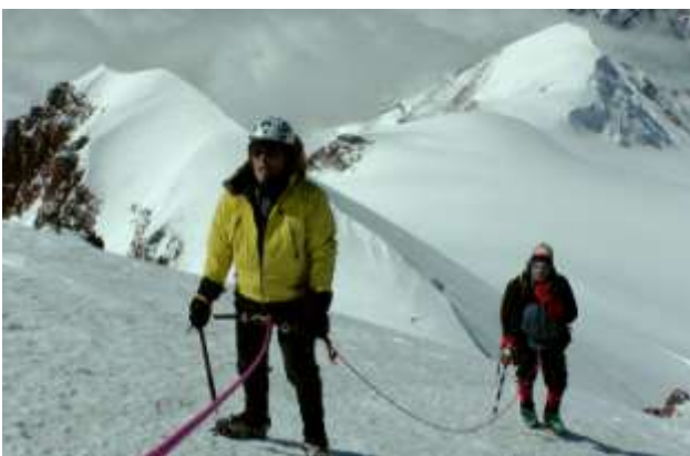
Последние метры перед вершиной