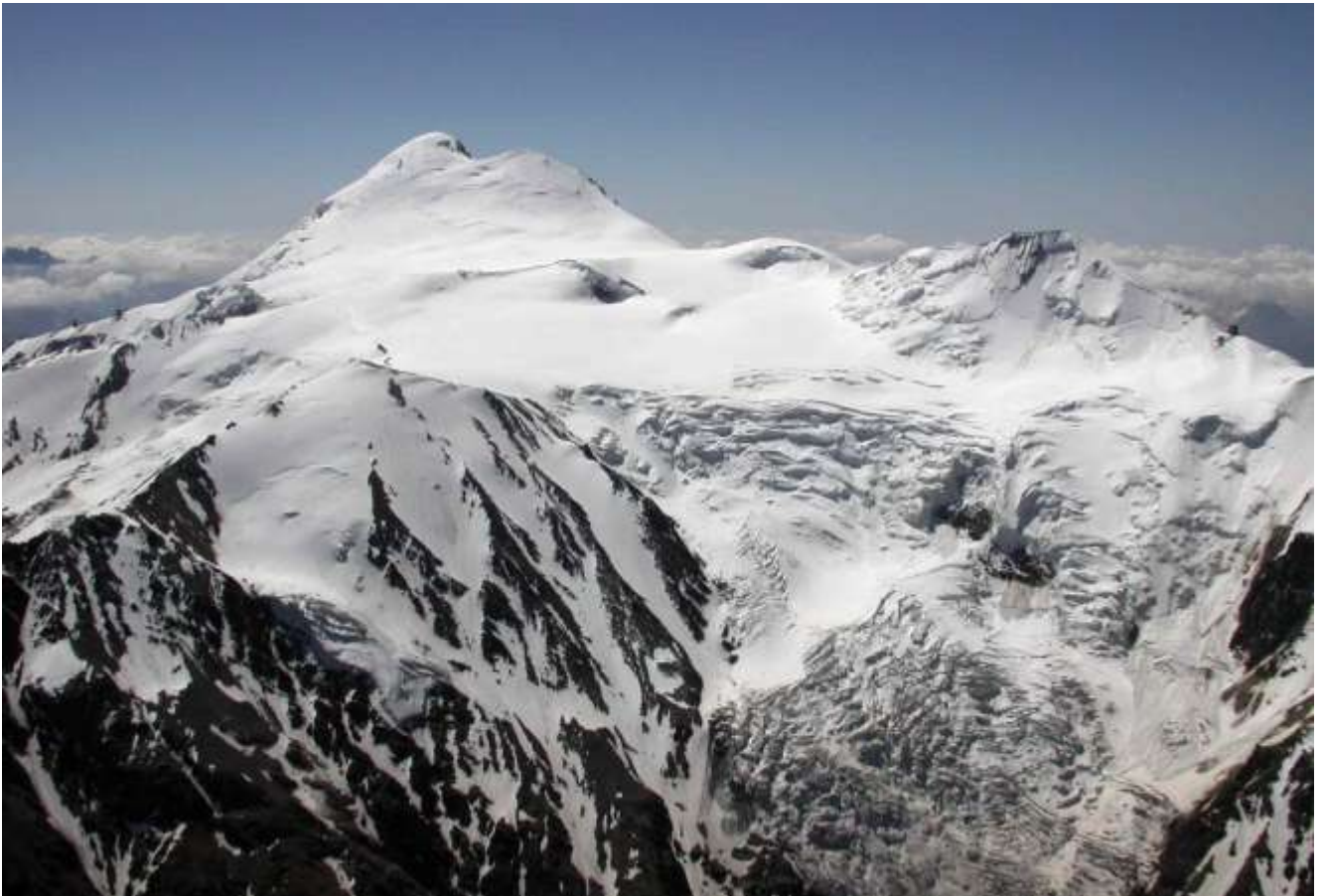
Ледник и плато Майли на фоне в.Казбек, 5033м. Вид с пика Геодезист