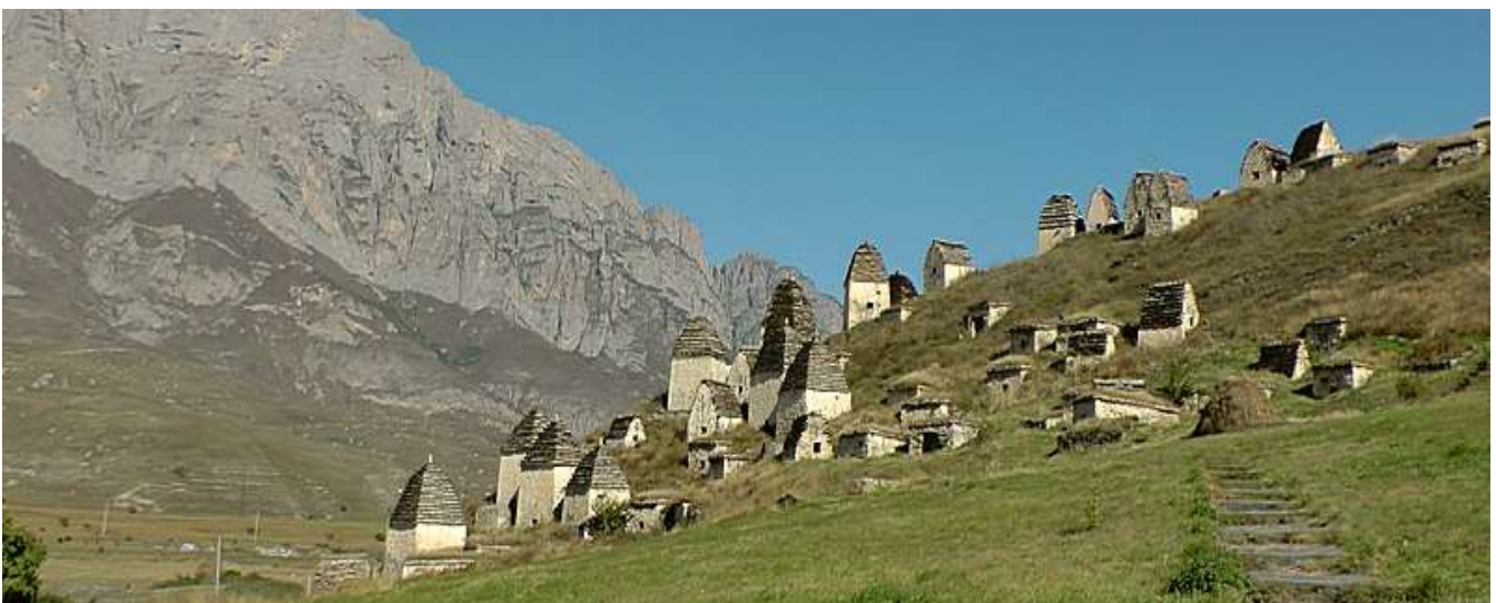
Даргавский некрополь (IX - XVIII век)