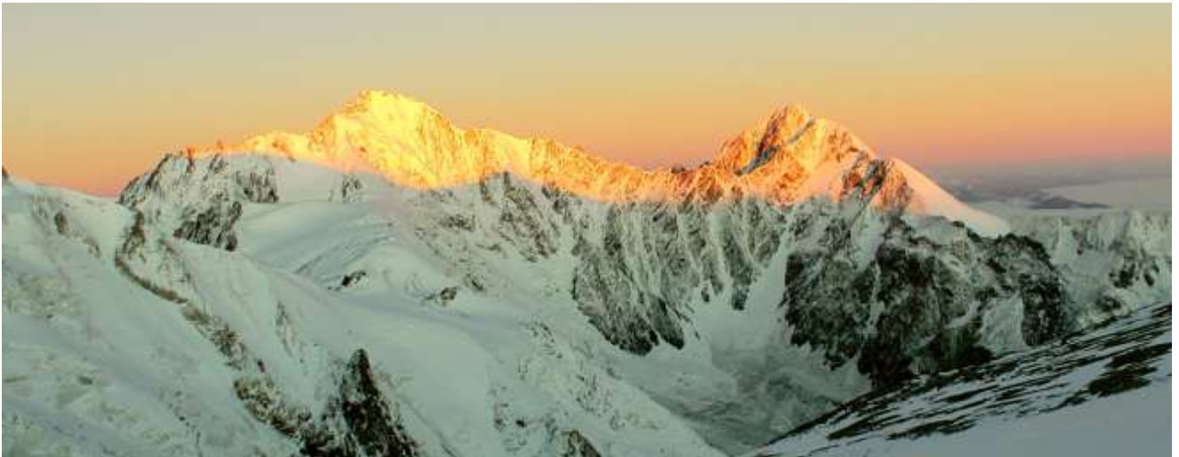
Рассвет, вид на в.Джимара (4780м) и Шау-хох (4638м) с Лагеря-2