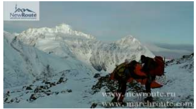
Вид на Лагерь-2, 4150м

День 4. Сегодняшний переход занимает всего 3-4 часа, однако из-за большого наклона склона и сложности рельефа (пересечение заснеженных кулуаров и каменных осыпей) некоторые части тропы требуют предельной концентрации внимания. Лагерь-2 расположен на моренной площадке в непосредственной близости к Майлинскому леднику на высоте 4150м.