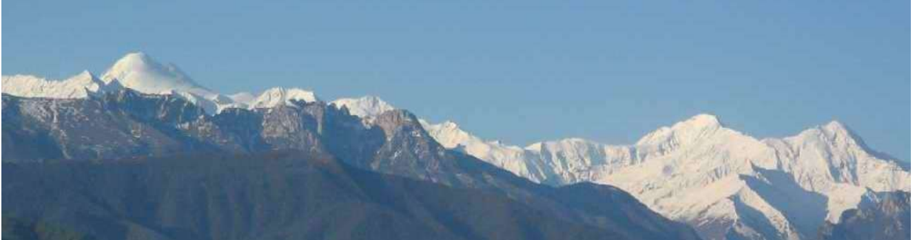
г.Казбек, 5033м, вид из гостиницы Владикавказ

День 1. После встречи с нашим представителем в аэропорту г.Беслан (или на ж/д станции г.Владикавказ), нам предстоит увлекательный переезд в Геналдонское ущелье, из которого и начинается наш маршрут. Колоритная горная дорога проходит по живописному ущелью р.Фиагдон. По пути нам будет встречаться множество древних родовых башен (башни строились как оборонительное, боевое, а нередко и жилое строение) и, конечно же, на восхитительные горные пейзажи. Так же мы посетим уникальный Даргавский некрополь (IX - XVIII век) - самый большой на Северном Кавказе (95 наземных и полуназемных склепов). Его иногда сравнивают с долиной фараонов в Египте.