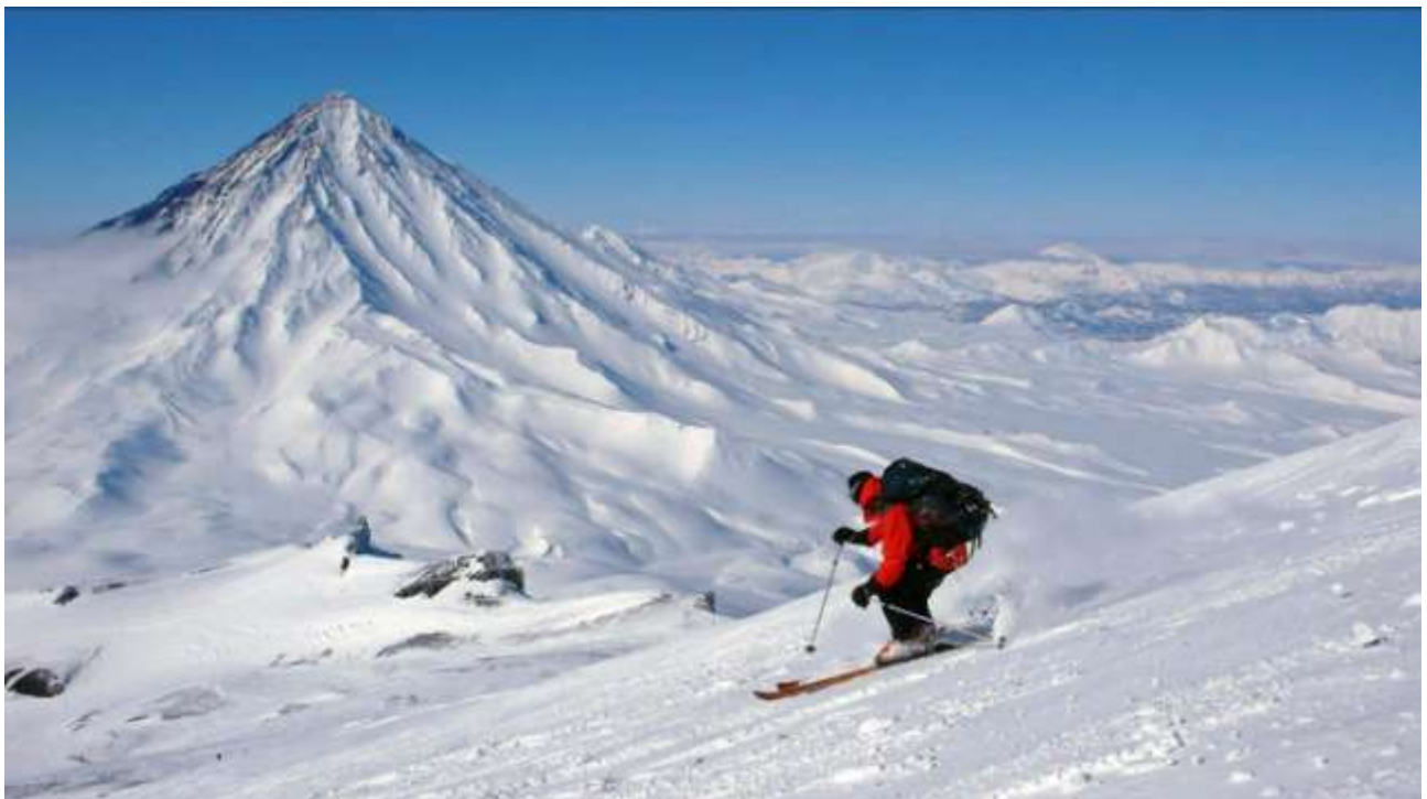
Спуск с Авачинского вулкана

День 3. Восхождение на Авачинский вулкан. Могут быть необходимы кошки. Наблюдение вулканической активности на вершине. Спуск по западному склону. Плотный снег, наст.