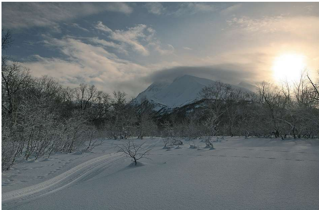
К горному массиву Вачкажсец

День 4. При благоприятных погодных условиях восхождение на Корякский вулкан. Необходимы кошки. Спуск по юго-восточному склону. Всегда спрессованный снег, наст. В случае плохой погоды ски-тур к к северо-западным склонам Авачинского вулкана.