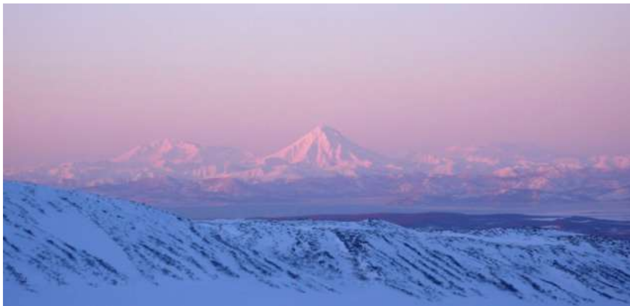
Вид на вулкан Вилучинский

День 8. Переезд на машине бхб в долину реки Паратунка (2 часа и более – в зависимости от – в зависимости от дорожных условий). Ски-тур на склонах Вилучинского вулкана (2173 м), перепад высот 1100 м. Возвращение в квартиры.